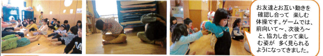
お友達とお互い動きを確認し合っ 楽しむ体操です。ゲームでは、前向いて〜、次後ろ〜と、協力し合っ 楽しむ姿が 多く見られるようになってきました。