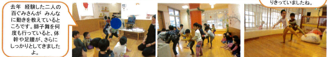
去年 経験した二人の百ぐみさんが みんなに動きを教えているところです。獅子舞を何度も行っていると、体幹や足腰が、さらにしっかりとしてきましたよ。