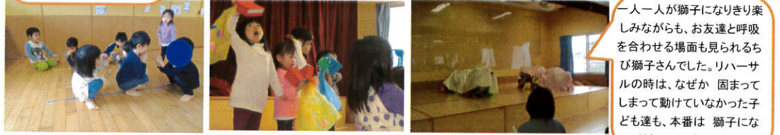
一人一人が獅子になりきり楽しみなながらも、お友達と呼吸を合わせる場面も見られる。リハーサルの時は、なぜか 固まってしまって動けなかった子ども達も、本番は 獅子になりきっていましたね。