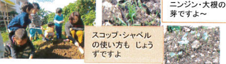
ニンジン・大根の芽ですよ〜