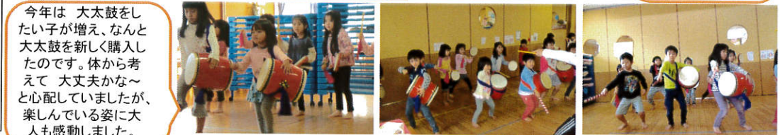
今年は 大太鼓をしたい子が増え、なんと大太鼓を新しく購入したのです。体から考えて 大丈夫かな〜と心配していましたが、楽しんでいる姿に大人も感動しました。