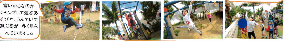
寒いからなのか ジャンプして遊ぶあそびや、うんで遊ぶ姿が 多く見られています。c