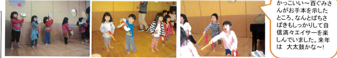
かっこいい〜百ぐみさんがお手本を示したところ、なんとぼちさばきもしっかりして自信満々エイサーを楽しんでいました。来年は 大太鼓かな〜!